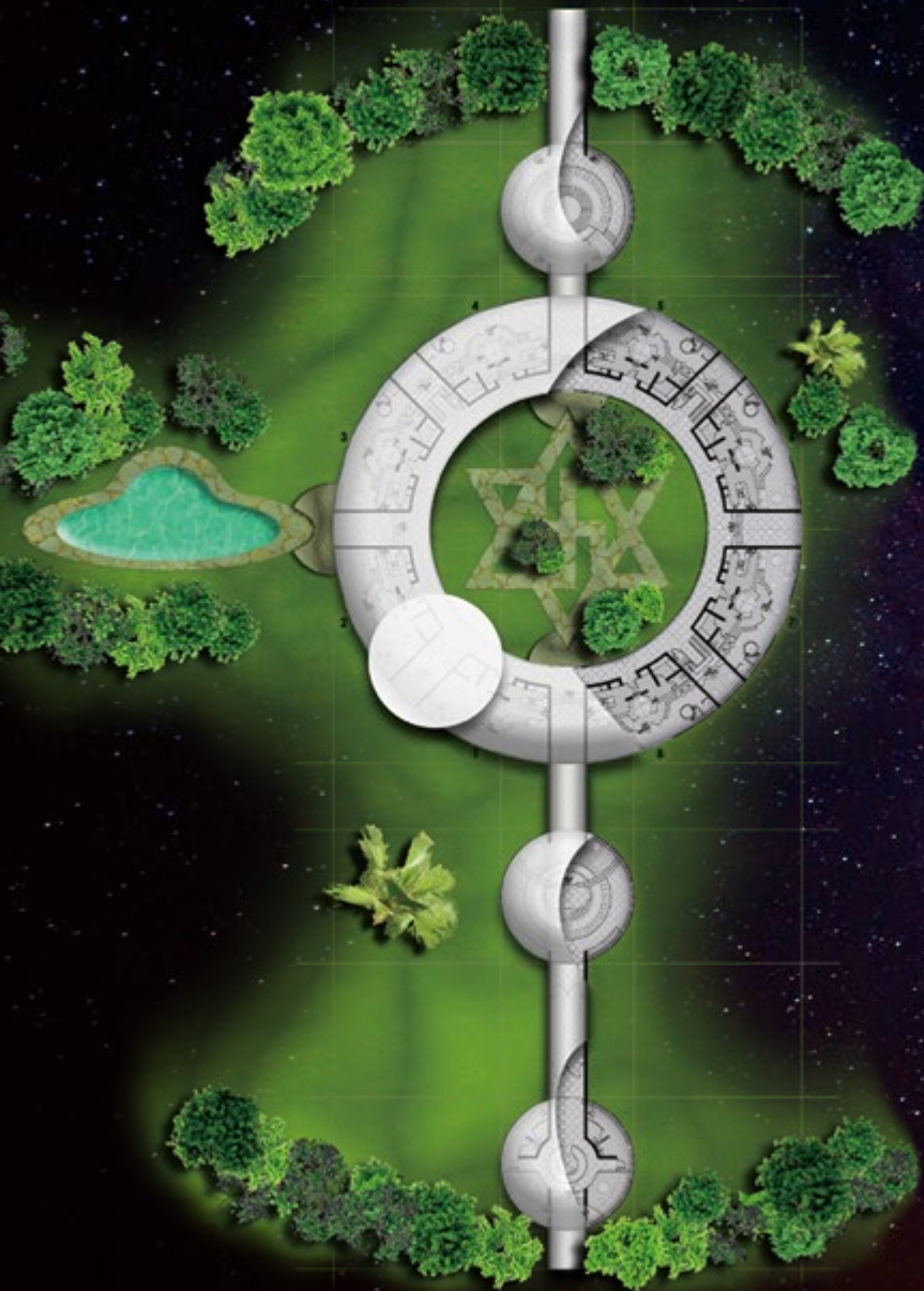
宇宙人大使館 完成イメージ